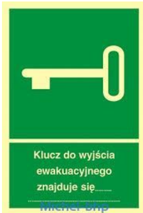
OZNACZENIE GDZIE ZNAJDUJE SIĘ KLUCZ