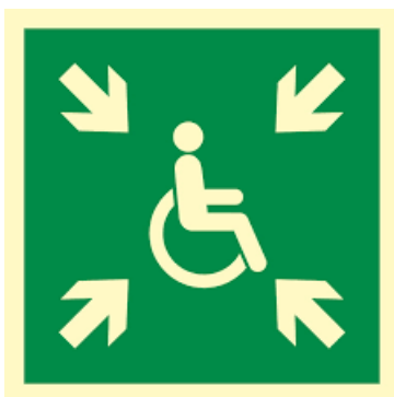
PUNKT ZBIÓRKI OSÓB Z NIEPEŁNOSPRAWNOŚCIAMI