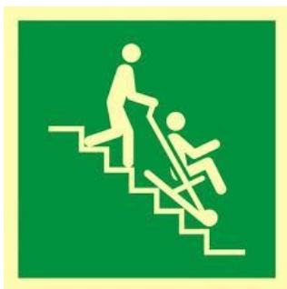
OZNACZENIE MIEJSCA Z KRZESŁEM