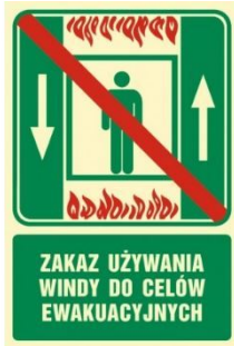
ZAKAZ UŻYWANIA WINDY W CZASIE POŻARU